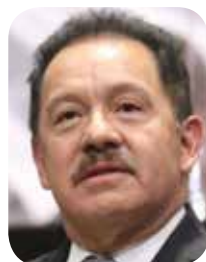
Ignacio Mier Velasco

El coordinador de los diputados de Morena en la Cámara Baja, Ignacio Mier Velasco, propondrá una consulta popular en el 2024, para que sea el pueblo el que elija a los ministros de la Suprema Corte de Justicia de la Nación (SCJN) mediante el voto directo del pueblo.