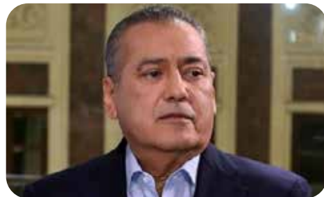
Manlio Fabio Beltrones