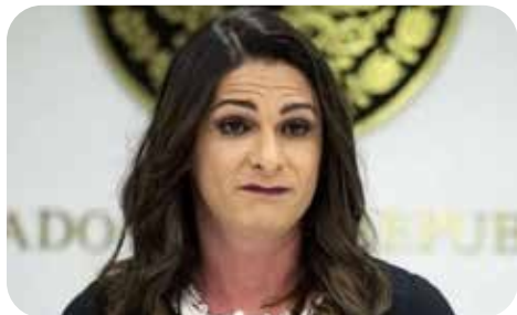
Ana Gabriela Guevara