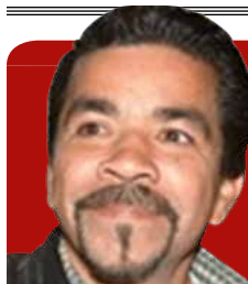
Columna de Arturo Soto Munguía