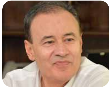
Alfonso Durazo Montaño